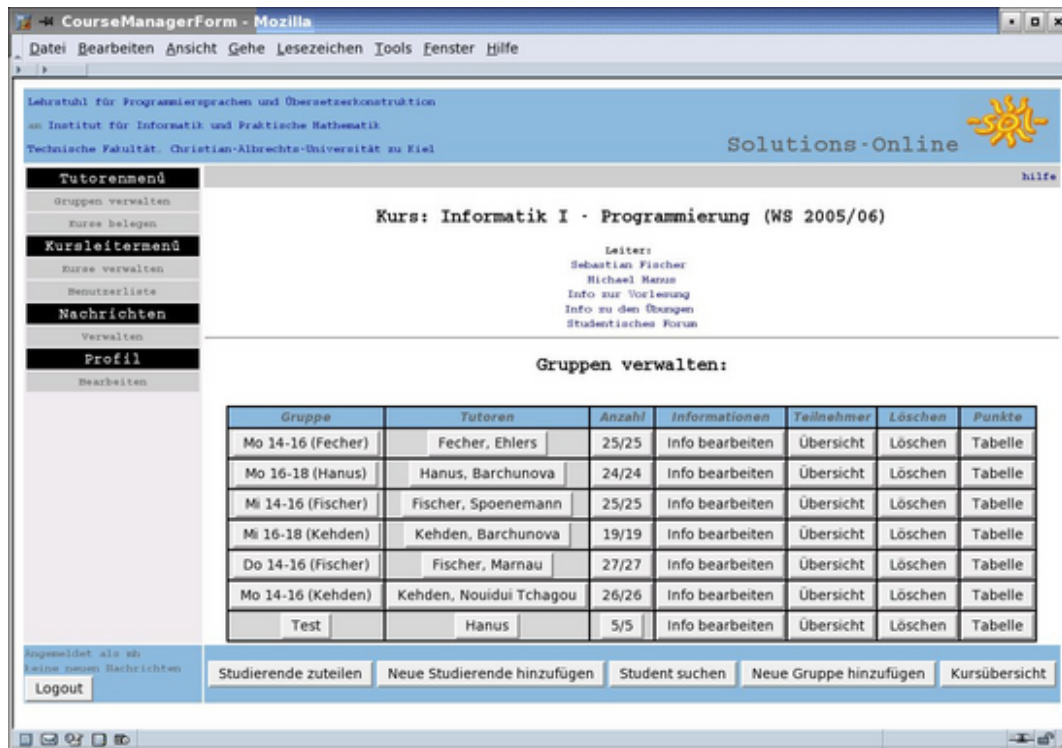
Abb. 1: Die Kursleitersicht im Web-basierten Übungssystem SOL